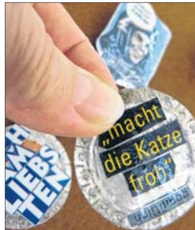
Zuerst wird der Kronkorken plattgeklopft und dann mit Bild...

Julia Förster antwortet überraschend Hochdeutsch: „Ich bin verwundert, wie viele große, historische Gebäude es in dieser kleinen