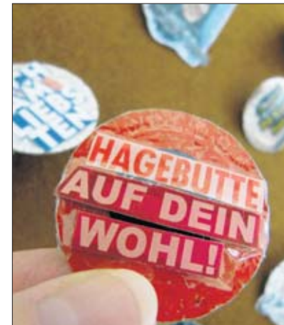
... oder Schrift versehen. Klarsicht-Streifen halten alles fest.

Stadt gibt.“ Besonders angetan haben es ihr die Backsteinbauten. Die Arbeit im Roten Pavillon habe sie als angenehm und nützlich empfunden. Nur die ersten drei Wochen, als sie noch gar niemanden kannte, seien sehr einsam gewesen, deutet sie an. „Wer in den Pavillon kommt, ist deutlich vierzig plus“, sagt sie. Der Kontakt zu einheimischen Jugendlichen sei schwierig.