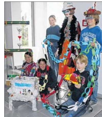
Münsterschüler fertigten Schmuckstücke für eine Ausstellung im Pavillon.

„Die Kinder haben selbstständig gearbeitet, vier Tage lang, allein oder in Arbeitsgruppen, die zum Thema gebildet wurden“, erklärt Pädagogin Cornelia Bönner. „Wir haben dann nur geschaut, was verbessert werden kann“, sagt sie. Derzeit stehen die „Schmuckstü-